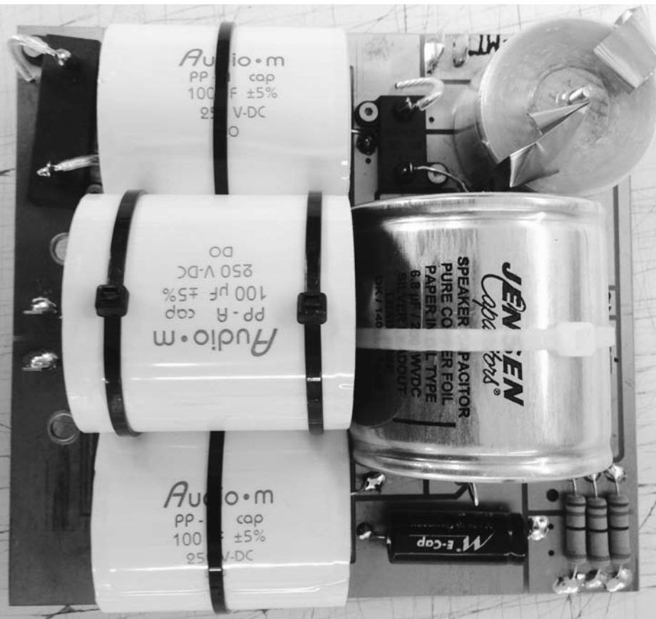
Edelste Bauteile auf der Frequenzweiche, etwa ein Jensen Ölpapier-Kondensator.

neuerer Veröffentlichungen meine Ausführungen zu konkretisieren. Fangen wir mit Maria Callas an. Die Londoner Abbey Road Studios haben in einem technischen Mammutprojekt sämtliche EMI-Studioaufnahmen der Callas von den Originalbändern in 24/96 remastert. Man kann zum einen die High Res Masterfiles herunterladen. Zum anderen gibt es eine wunderbare Box mit Begleitbuch, die sämtliche Aufnahmen als CDs enthält. Die EMI wurde ja vom Warner-Konzern übernommen. Und offensichtlich gibt es bei allen wirtschaftlichen Überlegungen und Zwängen in einem Großkonzern immer noch Raum für solche Projekte. Da ich ein haptischer Mensch bin, habe ich mich für die CD-Box entschieden. Es war eine Entdeckungsreise par excellence und ich hätte nicht geglaubt, was für eine bisher unentdeckt gebliebene Qualität in den alten Bändern steckt. Einige der legendären Einspielungen, etwa die beiden Norma-Auf-